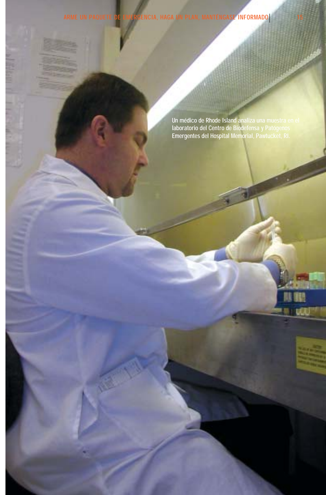
Un médico de Rhode Island analiza una muestra en el laboratorio del Centro de Biodefensa y Patógenos Emergentes del Hospital Memorial, Pawtucket, RI.