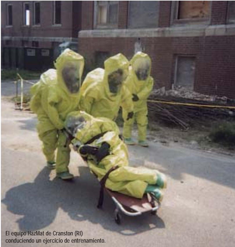
El equipo HazMat de Cranston (RI) conduciendo un ejercicio de entrenamiento.