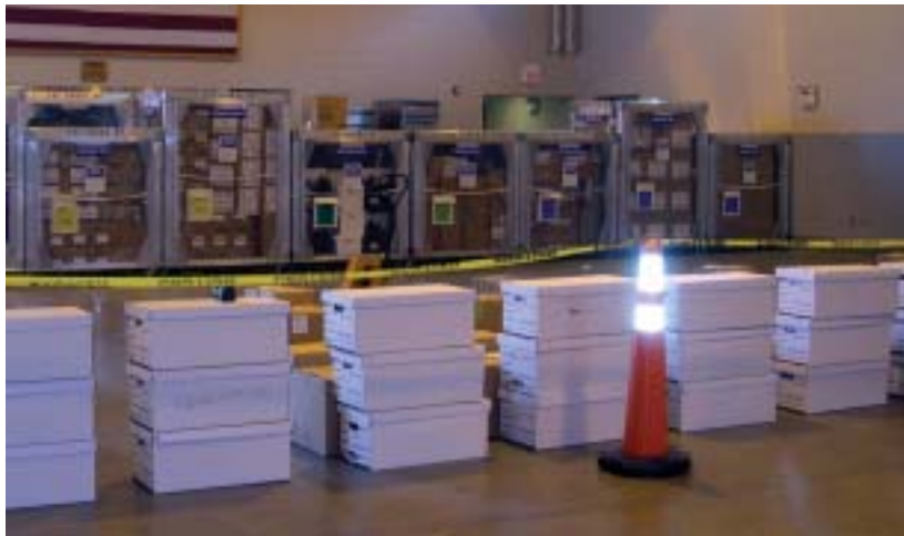
◀ Bodega con suministros simulados durante un simulacro de distribución de medicamentos por emergencia en Rhode Island.

Muchos de estos esfuerzos nos preparan mejor para otros acontecimientos, tales como brotes de enfermedades como la gripe o síndrome respiratorio agudo severo (SARS), así como para enfrentar accidentes industriales, como un derrame de sustancias químicas.